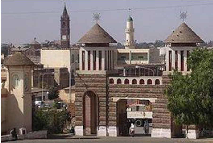
De Enda Mariam Orthodoxe Tewahedo kerk in Asmara is het boegbeeld van Asmara